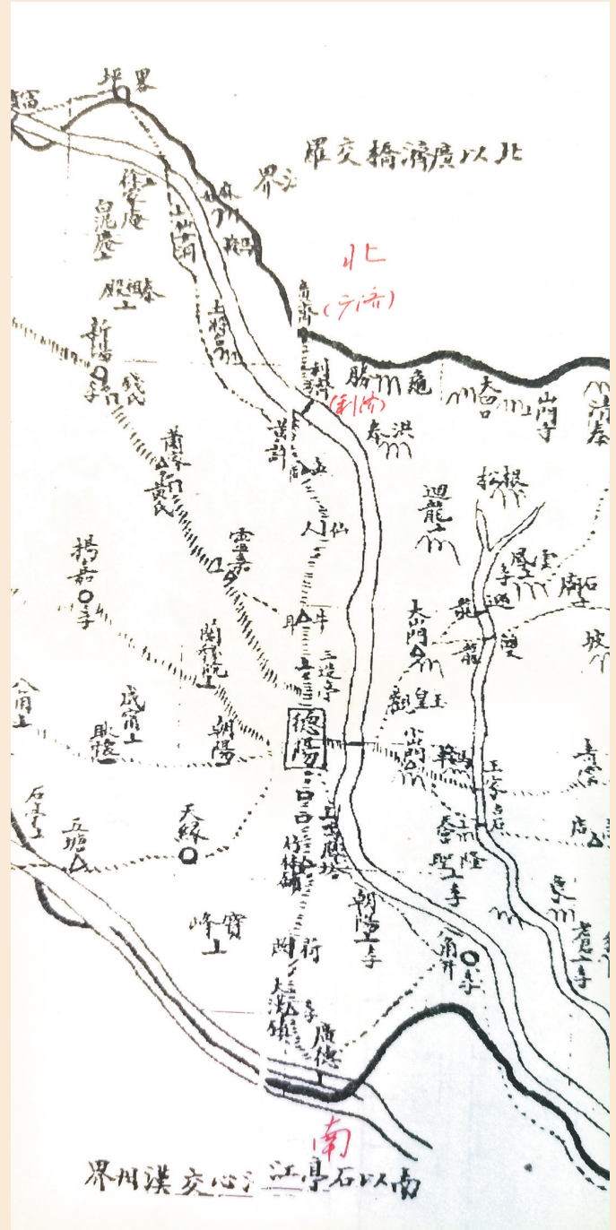
蜀道德阳南段，德阳—竹林铺—荷照桥—大汉镇—广德桥。 出自清末《德阳乡土志》

同治版《德阳县志》详细说明荷照桥位置、得名及修缮经过：“荷照桥，县南十八里。绵阳河支流所经，通省城赴京要路。长八丈余，邑人张奇富创修。嘉庆十六年（1811），张大有重修。以桥侧多种荷，故名。道光二十一年（1841），孙国良弟兄补修。同治二年（1863），曾孙、庠生德鹏等修。”笔者咨询相关人士，谓此桥早已不存，仅余地名而已。