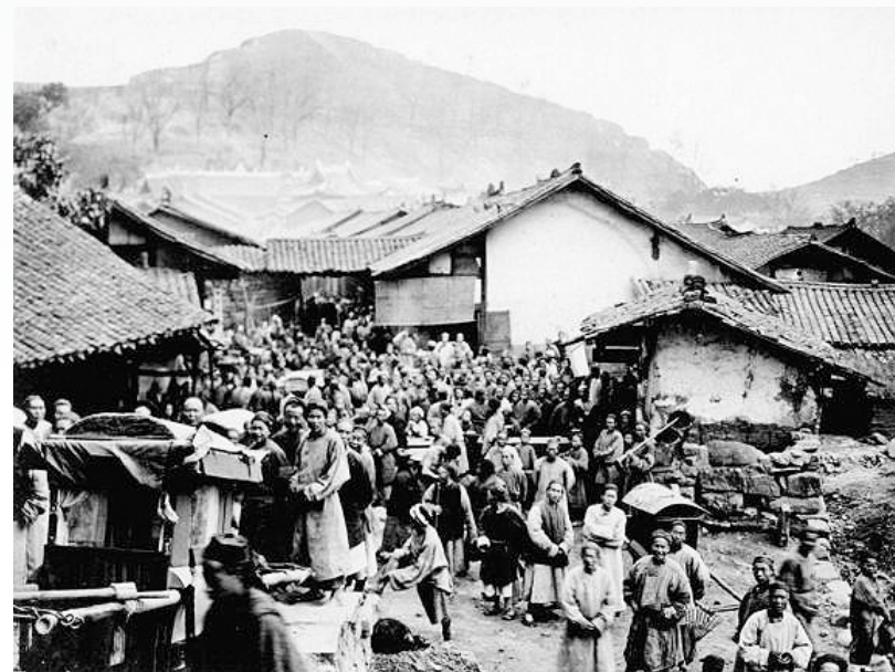
民国时期的龙台古镇风貌，由美国地质学家张柏林于1909年拍摄。

苏州另一名园狮子林，是元代晚期释家为纪念高僧中峰和尚所建，园内石峰林立，状如狮子，似高僧涅槃前常年所居的天目山狮子岩。数百年来，狮子林几易其手，成为释门庙