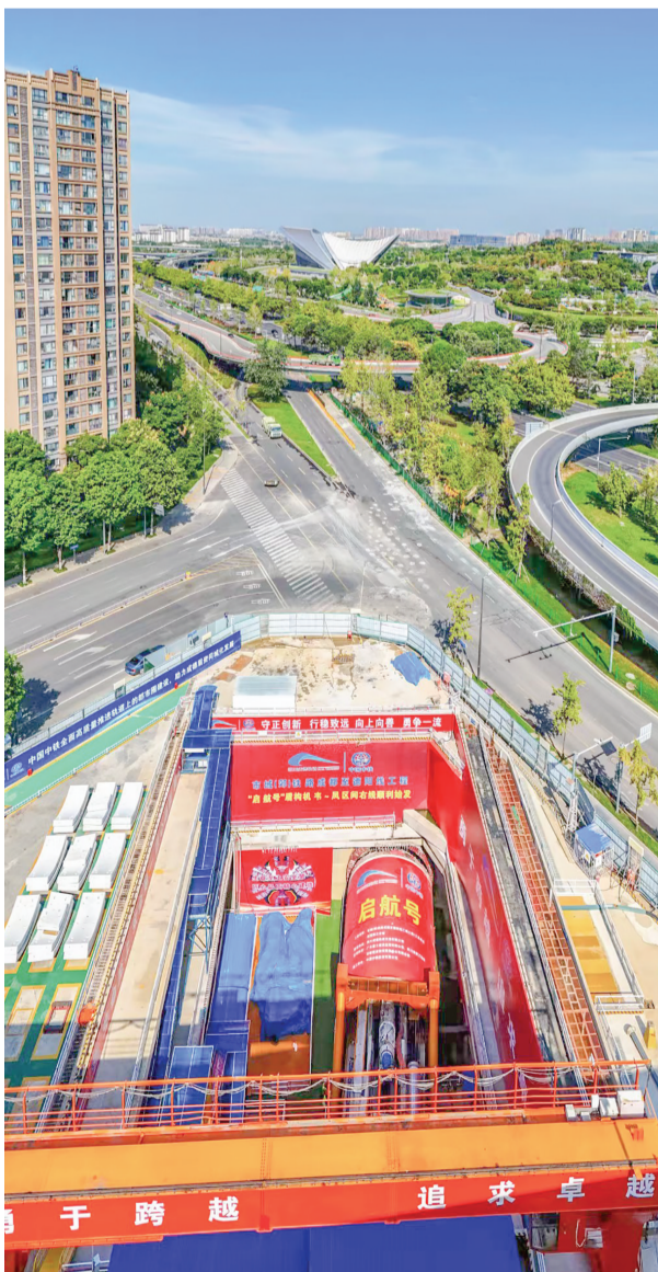
韦家碾站至凤台三路站盾构区间右线隧道顺利贯通。