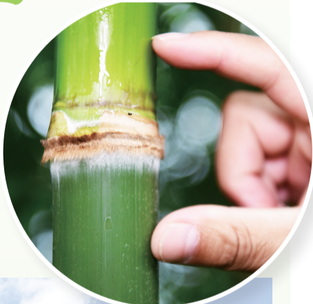
▲“绵竹”竹节上有两圈绒毛,分别向上和向下,像人的眼睫毛。