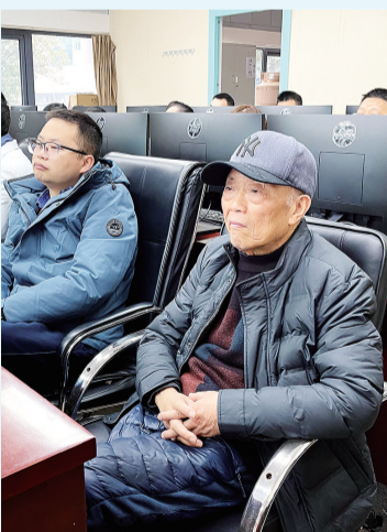
80岁高龄的汪老和晚辈一起学习信息系统的操作使用。