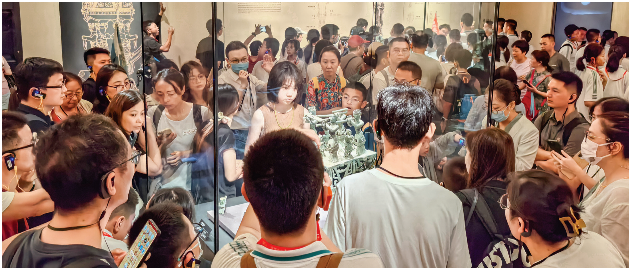
三星堆博物馆人流如织。