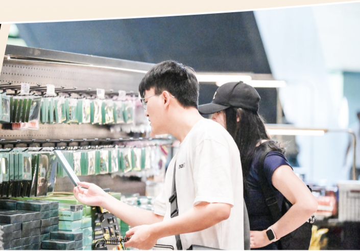
游客选购文创产品。