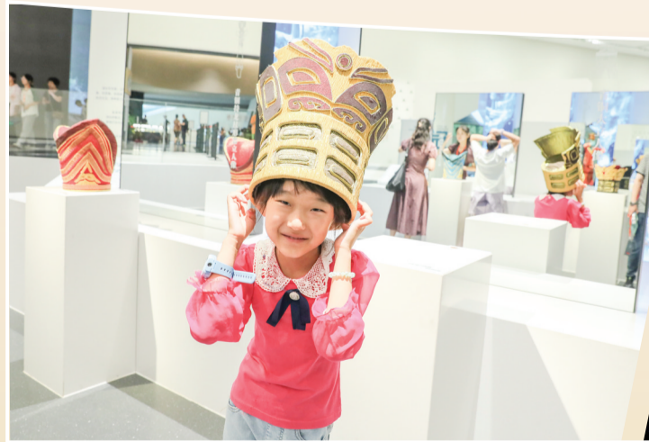
体验三星堆人的发冠。

6月9日,“邂逅三星堆—12K微距看国宝”全球巡展在卡塔尔盛大启幕,成为该系列展的第一站,受到当地群众的热捧。几天之后,“三星堆·金沙主题数字展暨推介活动”在埃及开罗开幕,以裸眼3D技术、高精度文物复制、VR互动体验等多种现代科技形式,为埃及观众呈现了一个鲜活、立体的古蜀世界,让人仿佛置身于数千年前的古蜀……三星堆文物,作为中国独特的文化标识,已成为向世界讲好中国故事的最佳名片之一。本报记者 邱洁