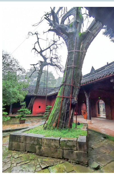
现在的“龙柏”“凤柏”“凤柏”位置在台阶上。

名木古树，都有着百年以上的历史，有的树龄超过千年。他们见证了社会历史的变迁，承载着厚重的文化底蕴，有着极高的科学研究和生态价值，是值得人们倾情守护的“国宝”。罗江境内，有数百株列入保护级别的名木古树，其中四株树龄在千年以上。