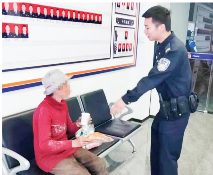
老人在派出所休息。