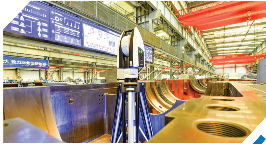
作为川渝共建装备制造产业集群的头部企业,东方汽轮机建成行业首个总装数字化车间。

对于下一步工作重点,市发改委相关负责人表示,“我们将牢记总书记嘱托,继续积极推进与重庆的区域协同发展。同时,紧扣国家最新政策导向,谋划储备一批强基础、增功能、利长远的重大项目,争取纳入四川省共建成渝地区双城经济圈2024年重大项目清单的项目不少于10个。还将尽快落实德阳市高质量推进成渝地区双城经济圈建设考评细则,督促各区(市、县)、德阳经开区和市级相关部门保质保量完成年初目标任务,顺利迎接成渝地区双城经济圈建设省政务目标考核。”