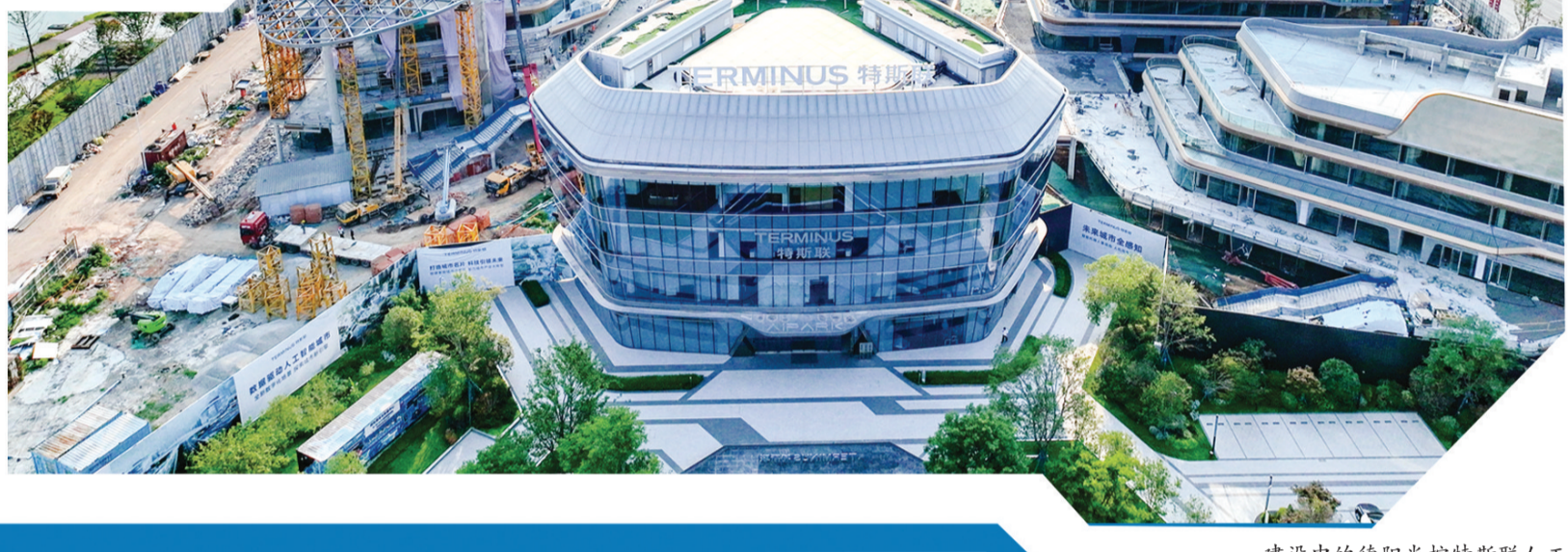
建设中的德阳光控特联人工智能城市项目。