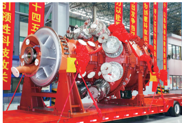
国内首台完全自主知识产权F级50MW重型燃气轮机在东方汽轮机发运。

跨越3000年，制造基因令这块土地再放异彩。今天的德阳，已拥有千亿级装备制造产业集群，华龙一号、三峡大坝、白鹤滩水电站、神州系列飞船、多类型战斗机、C919大飞机、深海潜水器等皆与它息息相关。“德阳制造”囊括了全国60%的核电产品、50%的大型电站铸锻件、40%的水电机组、30%的火电机组。发电设备产量世界第一，石油钻机出口全国第一！