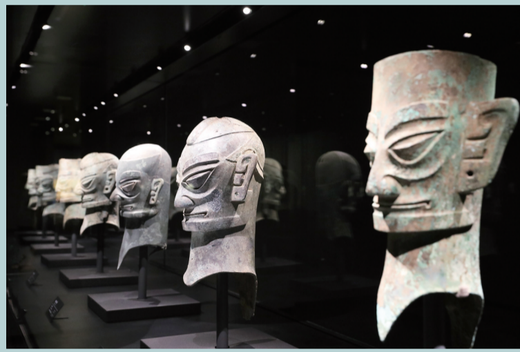
远古工匠们已经掌握了精湛的制造技术。图为青铜面具集体亮相三星堆博物馆新馆。