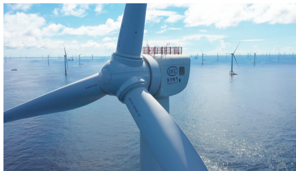
东方风电自主研发的7.5兆瓦海上风电机组。