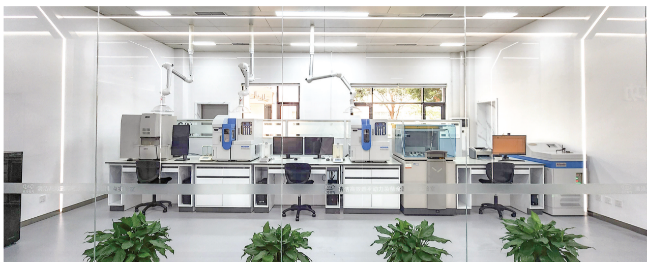
东汽精神教育基地科技创新成果展示厅内景。

移步至争先馆,记者看到该馆展出部分材料研究设备,由一条走廊及两侧的7个理化研究实验室构成,可通过落地玻璃隔断参观各实验室工作情况。“大型科研仪器设备总价值超过10