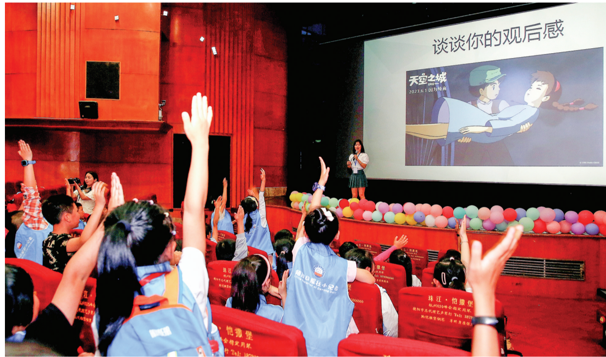
小记者们踊跃回答问题。