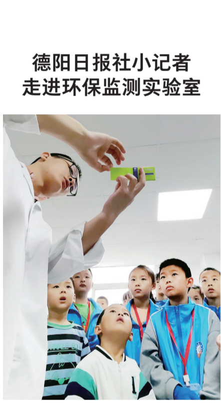
德阳生态环境监测中心监测实验室的工作人员正在向德阳日报社小记者介绍相关环保知识。

德阳日报社小记者走进环保监测实验室 德阳生态环境监测中心监测实验室的工作人员正在向德阳日报社小记者介绍相关环保知识。