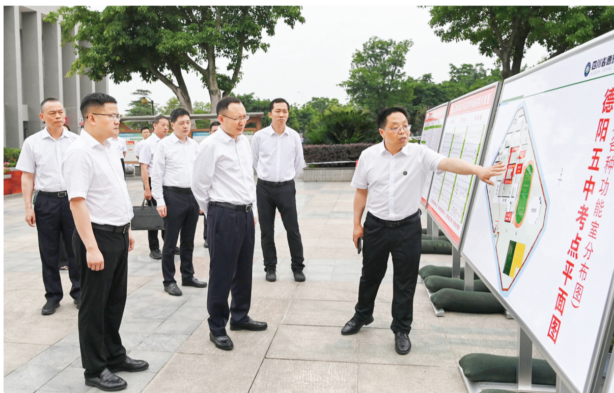
6月5日上午,市委书记李文清前往德阳五中天元校区督导检查高考备考工作。

在随后召开的座谈会上,李文清对各地各部门考务工作给予肯定。他强调,高考事关国家选才育才,连着社会民心,关系千家万户。各级各相关部门要进一步提高政治站位,精益求精做好各环节工作,全力服务好、保障好、支持好高考。要加强交通疏导和管控,维持好主干道路及考点周边交通秩序,确保考生安全、顺畅赴考。要坚持