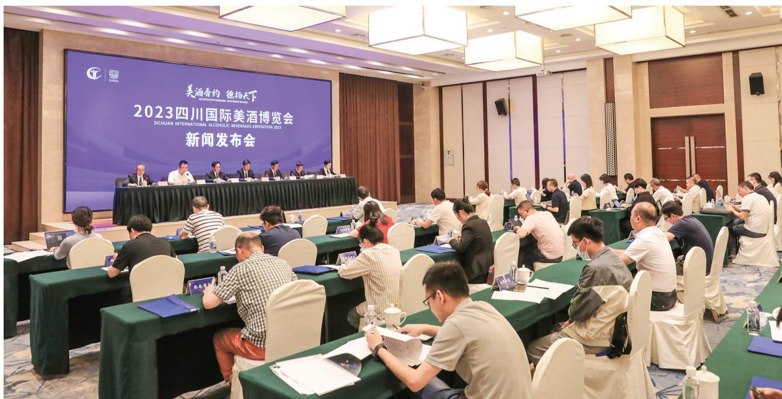
6月2日,2023四川国际美酒博览会新闻发布会在成都召开。本报记者 文潇 摄

在品牌保护方面,做实一个“聚”字,举办中国酒业协会知识产权保护工作委员会2023年理事(扩大)会议暨中国酒业知识产权论坛,集聚各方力量全面提升酒业知识产权保护能力。在国际交流方面,描绘一个“融”字,召开