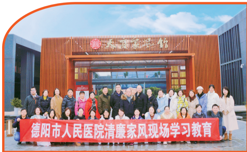
赴“天府家风馆”参观学习。