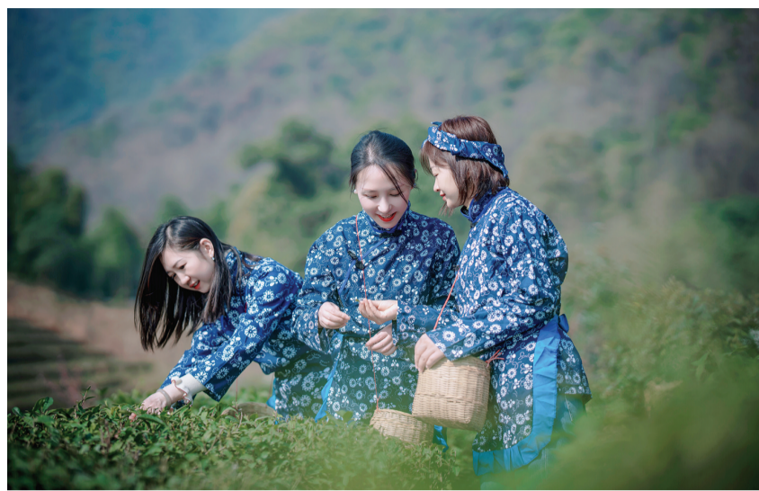
踏青游客当起了“采茶姑娘”。

“目前,每天共有80余名采茶工人采茶,能采摘鲜叶5000斤左右,生产高品质绿茶2000斤左右,预计3月中旬达