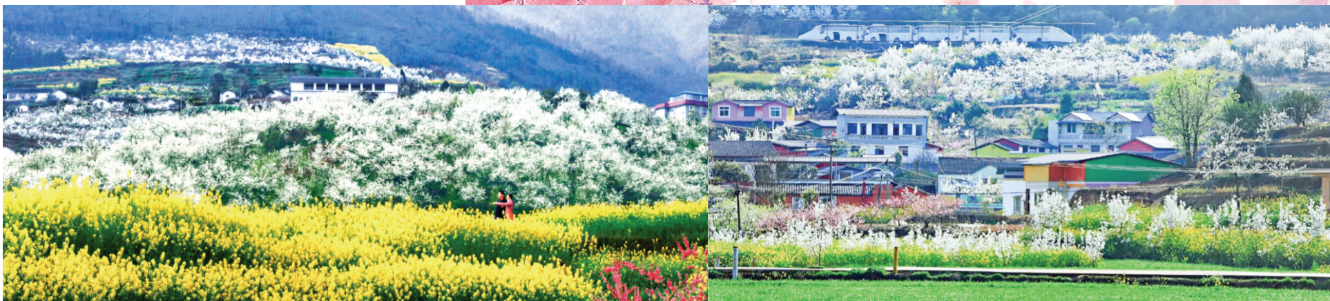
绵竹九龙山—麓棠山旅游区。