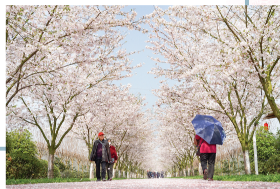
什邡四季东城樱花烂漫。