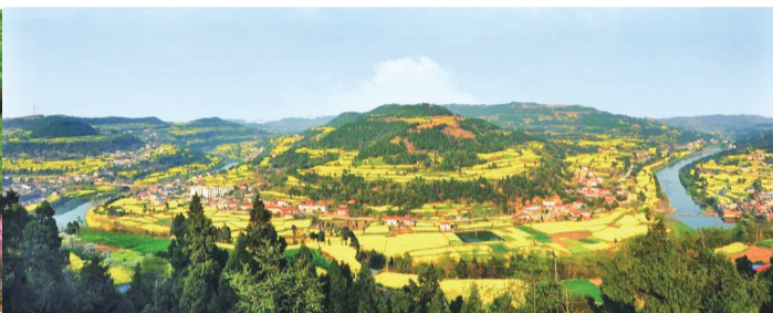
旌阳区双东镇“凯江大回湾”。